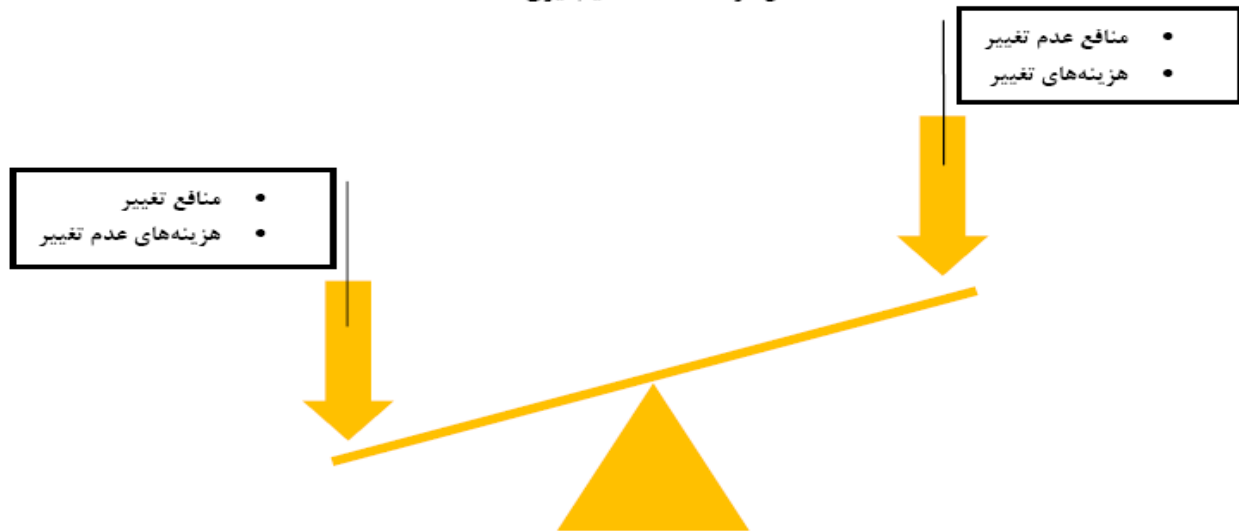
شکل دو الاکلنگ تصمیم‌گیری

یک راه دیگر تشویق بیمار در نظر گرفتن هزینه‌ها و منافع مصرف فعلی مواد، کمک به آنها برای ترسیم جدول مشابه جدول صفحه بعد است. این جدول می‌تواند هنگام درخواست از بیمار برای صحبت درباره جنبه‌های خوب و نه چندان خوب مصرف مواد کمک کننده باشد.